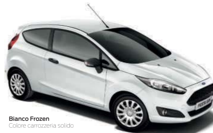
Bianco Frozen Colore carrozzeria solido