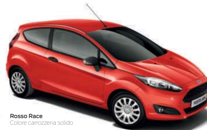
Rosso Race Colore carrozzeria solido