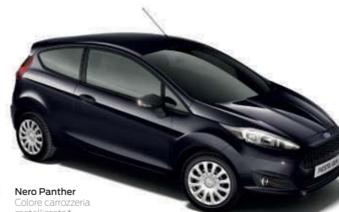
Nero Panther Colore carrozzeria metallizzato*