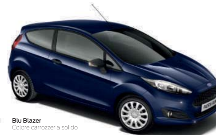
Blu Blazer Colore carrozzeria solido