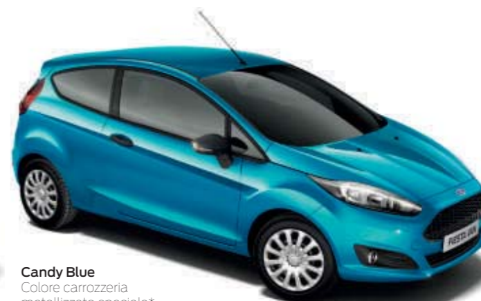
Candy Blue Colore carrozzeria metallizzato speciale*