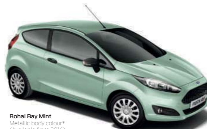
Bohai Bay Mint Metallic body colour* (Available from 2016)