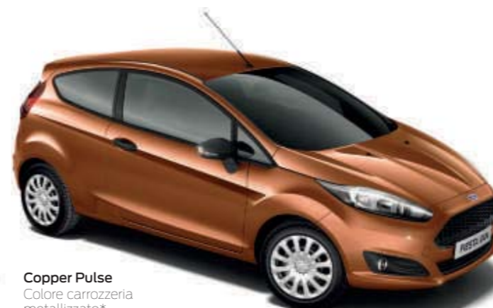
Copper Pulse Colore carrozzeria metallizzato*