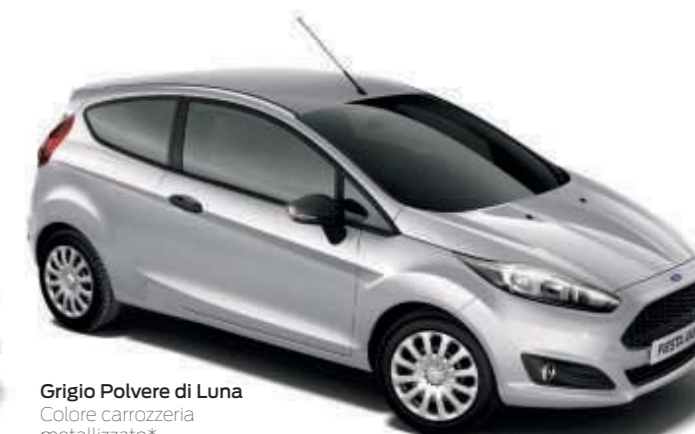
Grigio Polvere di Luna Colore carrozzeria metallizzato*