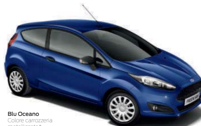
Blu Oceano Colore carrozzeria metallizzato*