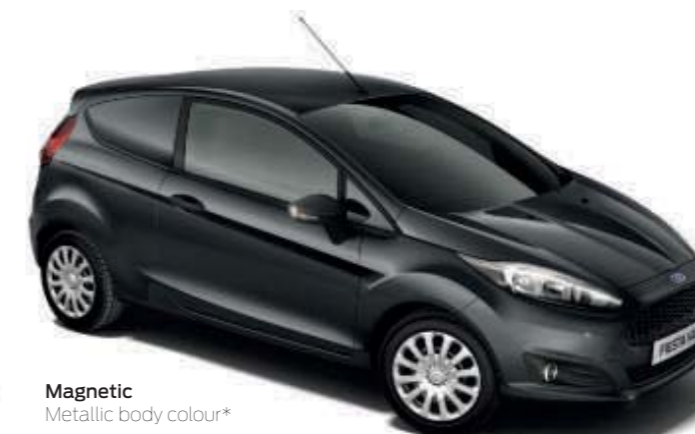
Magnetic Metallic body colour*